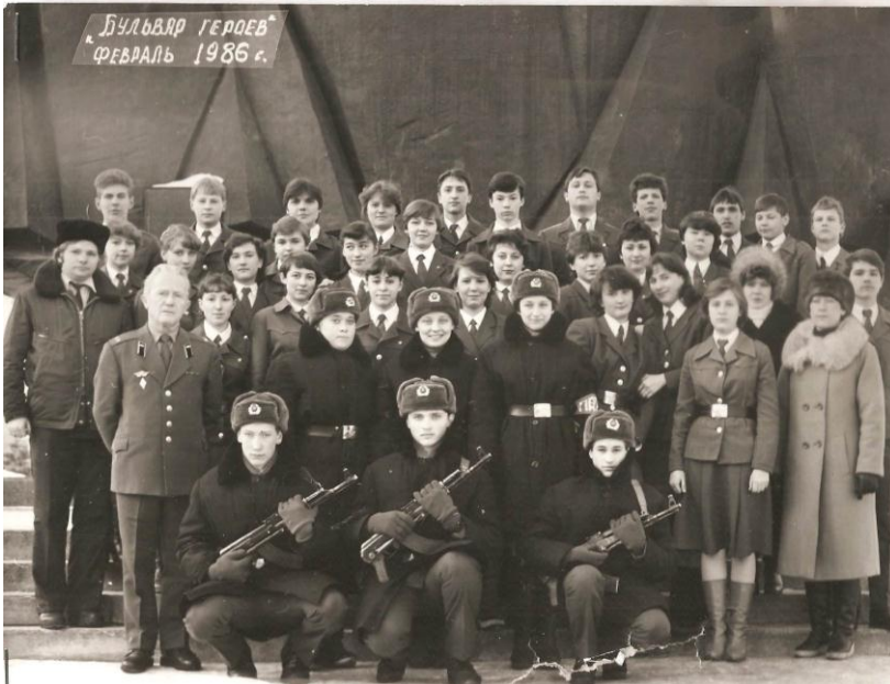
Пост №1 – 1986 г.