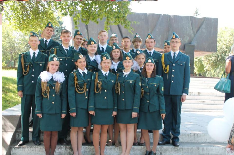
Пост №1 – 2013г.